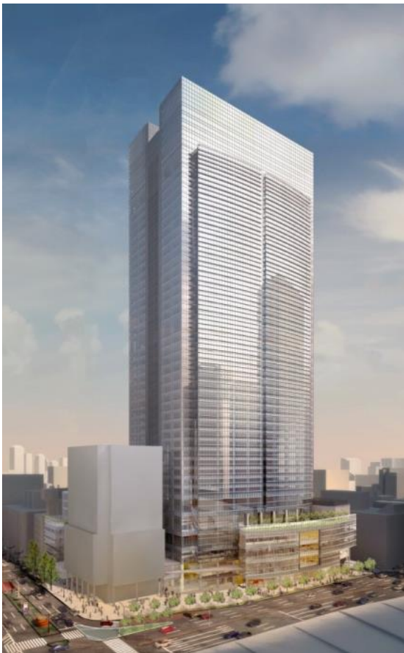
(東京駅上空から望む)