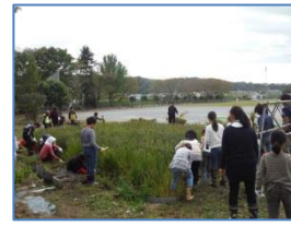
子供たちの収穫体験 (日野市)