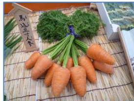
馬込三寸ニンジン (江戸東京野菜)