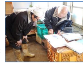
GAP認証取得に向けた管理記録簿確認