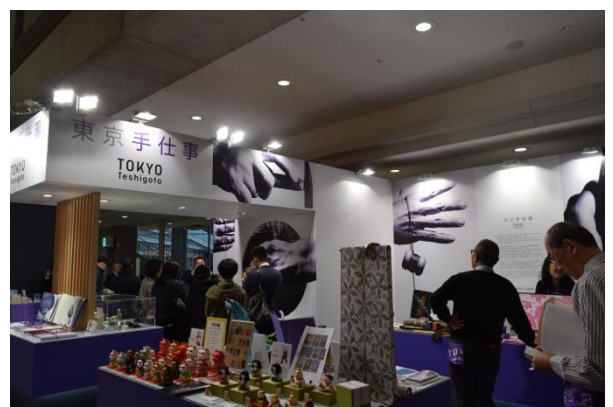
展示会出展の様子(普及促進)