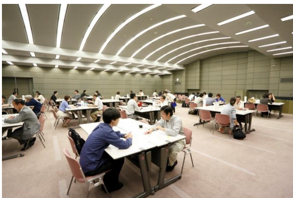
マッチング会の様子(商品開発)