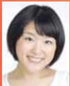
横田めぐみ：森本優里