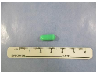
番号4：緑色カプセル