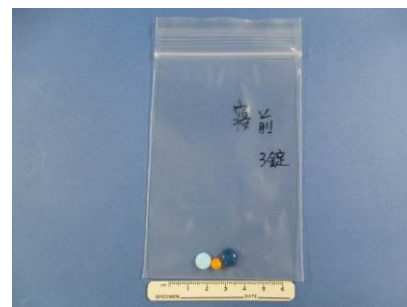
番号5, 6, 7が入っていた包装