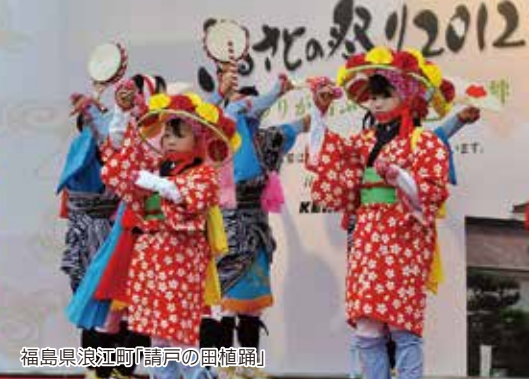
福島県浪江町「清戸の田植踊」