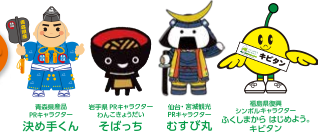
青森県産品 PRキャラクター 決め手くん