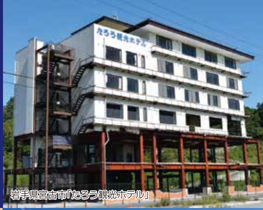
岩手県宮古市「たろろ観光ホテル」