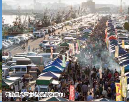
青森県八戸市「鯉島岸壁朝市」