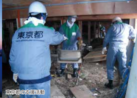
東京都の支援活動