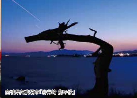
宮城県気仙沼市「岩井崎 龍の松」