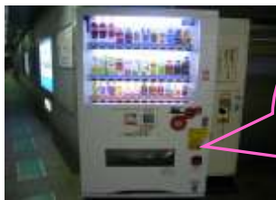
PASMO募金は、このステッカーが目印！