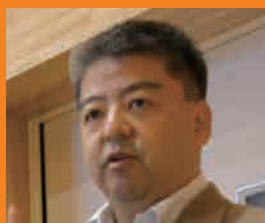
(特非)多文化共生マネージャー 全国協議会 理事