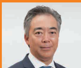
森ビル株式会社 取締役副社長 執行役員