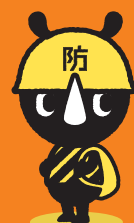
東京防災公式キャラクター 「防サイくん」