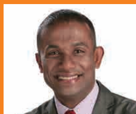
羽衣国際大学教授・タレント