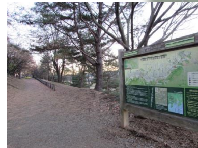
歴史の道100選に認定された「多摩よこやまの道」