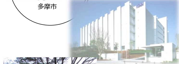
立地企業イメージ