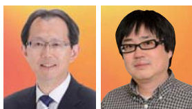
福島県知事 内堀 雅雄