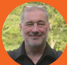
フレンチシェフ ドミニク・コルビ