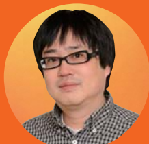
俳優 六角 精児