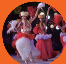
スバリゾートハワイアンズ ダンシングチーム