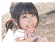
タレント 稲村 亜美