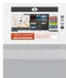
卓上型 W404×H433×D315 (単位：mm)

旅行者が都内の観光情報を多言語にて入手できるデジタルサイネージ(端末、コンテンツ)を、観光案内窓口の皆様に貸与します。