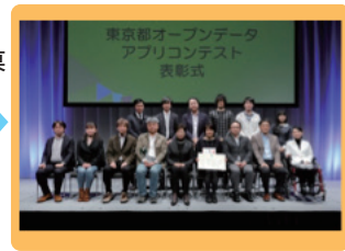
オープンデータ アプリコンテスト