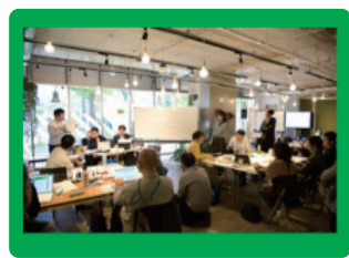
オープンデータ アイデアソンキャラバン

このたび、審査会を経て、選ばれた作品の発表会・表彰式を開催することとし、一般来場者の参加申し込みを開始します。製作者によるプレゼンテーションや表彰式だけでなく、展示スペースやトークセッション等、お楽しみいただけるプログラムをご用意しています。皆様のご来場をお待ちしています。