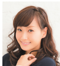
タレント 藤本 美貴 Miki Fujimoto

災害から自分や大切な人を守るためには、一人ひとりが災害について知り、日頃からどう備えるかを考えるとともに、地域でともに支え合うことが必要です。「家族」と「地域」のために、災害から身を守るため「今」できる備えを、一緒に考えてみませんか? 皆さまの参加をお待ちしています!