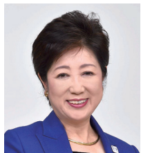
東京都知事 小池 百合子 Yuriko Koike