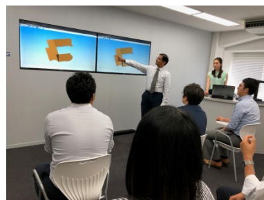
▲顧客に自社のサービスをプレゼンする様子

精密板金事業者を中心に顧客の現状を重視したソリューションを提供することで、顧客との関係性を構築している。本計画により約100社に導入し、短期間で業績を向上させた。