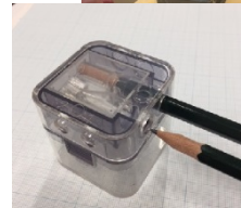
▲鉛筆削り器と東京ペンシルラボ