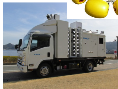
▲開発した計測機器及び計測ロボット