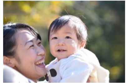
▲ITで安全かつ迅速なサービスを実現

子供を預かってほしい親と働きたいベビーシッターをシステムを介して結びつけることで、双方のニーズを叶える仕組み。多様な働き方を実現させ、業績を向上させている。