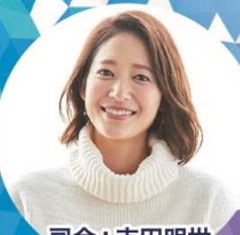
司会：吉田明世 (フリーアナウンサー)