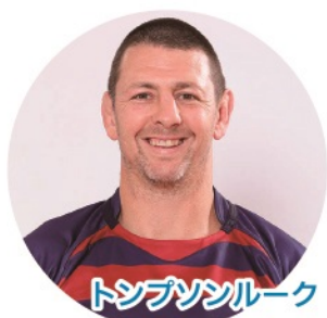
トンプソンルーク

大畑大介(元ラグビー日本代表/ 東京オリンピック・パラリンピック競技大会組織委員会アスリート委員会委員)