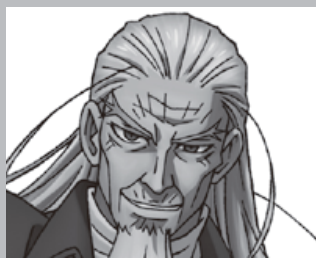
ひじかた としぞう 土方 歳三