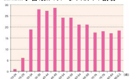
子宮頸がんになった人の割合

早期のうちには症状がないため、「子宮頸がんにかかっている」と自分で気が付くことは困難ですが、検診で早期に発見し早期のうちに治療すれば、90%以上が助かることが分かっています。