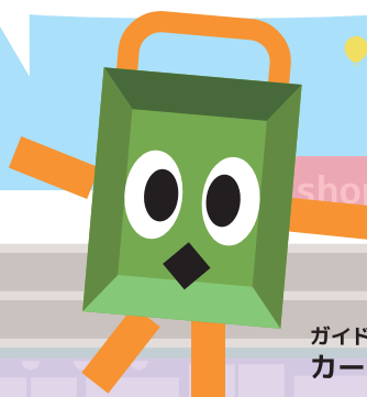
ガイドロボット カートくん