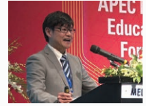
シンポジウムの座長