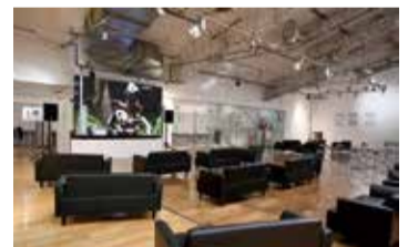
東京スポーツスクエア内