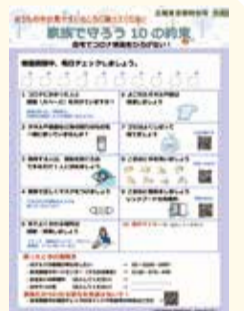
家族で守ろう10の約束