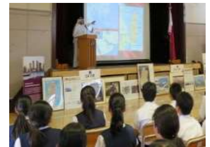
在京大使館や国際交流団体と連携した交流体験