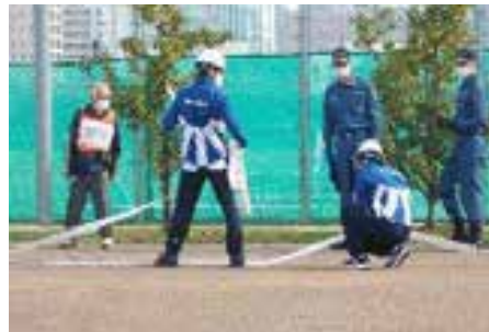
自治体や家庭と連携し、防災訓練等の地域行事参加