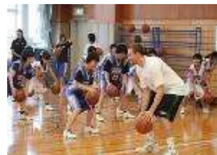
トップアスリートによる講演・体験教室