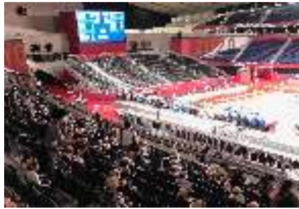
組織委員会や各家庭と安全対策を講じ実施した競技観戦