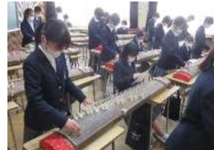
芸術・文化団体と連携した音楽体験