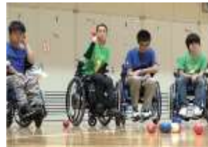
パラ競技団体や近隣学校と連携したパラスポーツ交流