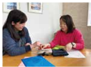
シーバーポーチのカラー展開を企画するプロジェクト会議