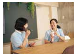
休憩60分をカフェ風休憩室で