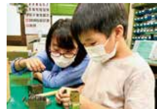
地域の小学生に金属加工を教える若手女性職人