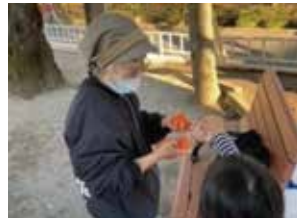
子どもたちに伝承文化「お手玉」を教えています。