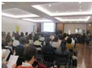
厚生省自殺予防オープンセミナー