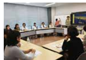
リーダーシップ向上セミナー