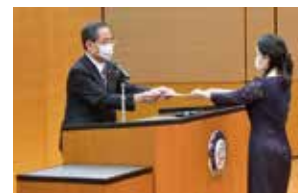
女性上位職登用制度記念式典