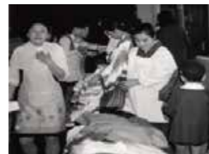
バザー風景 昭和50年代