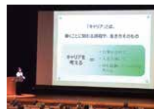
洗足学園高校キャリア教育講演