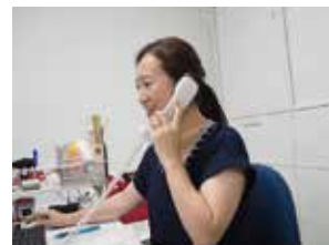
電話による通信販売営業の様子