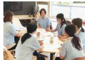
勤務時間内に行っている研修の様子