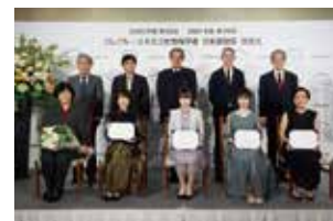
「ロレアル・ユネスコ女性科学者 日本奨励賞」授賞式