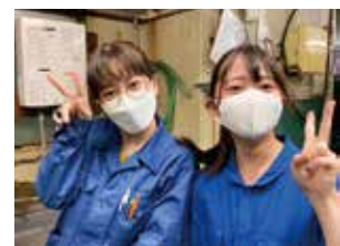
年2回行うインターンシップにも多くの女性が参加