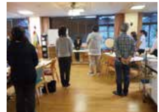
外部講師を招いての接遇マナー研修