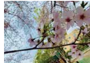
活動拠点は、春に桜が満開になる公園。交流を図るきっかけになります。