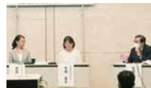
～ダイバーシティ研究環境実現に向けて～ キックオフシンポジウム パネルディスカッション