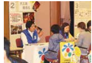
特養ホームにおける就職フェアでの相談風景