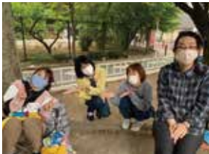
密に配慮しつつ、遊びに来たパパママと話をしたり、お子さんと一緒に遊んだりして楽しくすごします。