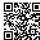
東京水辺ライン公式HP