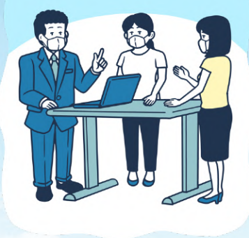
◆スタンディングミーティング