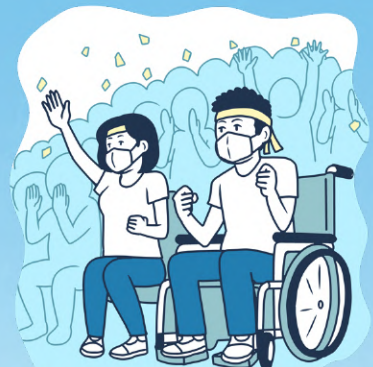
◆アスリートの応援支援・スポーツ大会の協賛