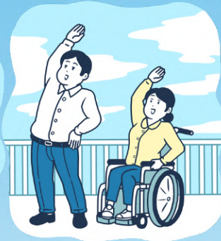
◆オフィスでみんな体操