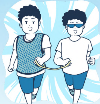
◆障害者アスリートの雇用