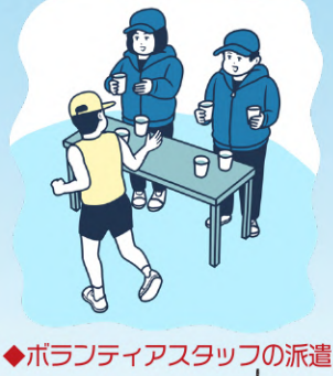
◆ボランティアスタッフの派遣