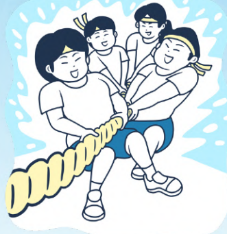
◆スポーツイベントの実施