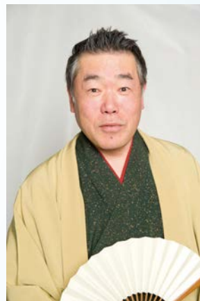
落語家 桂雀々 師匠