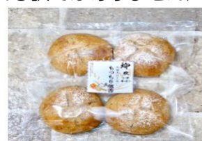
発酵大豆玄米パン