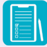
参加票記入・提出