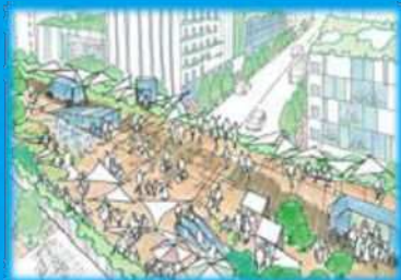
新しい都市の視点場