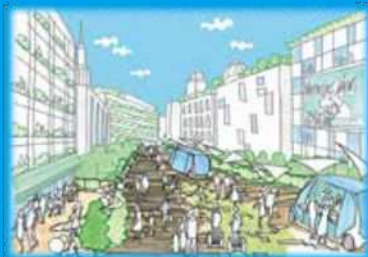
にぎわいと交流の場