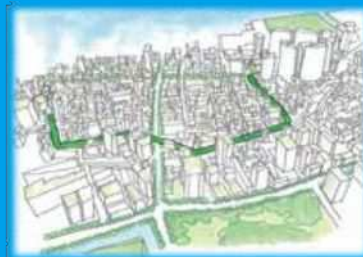
新しいみどりのネットワーク

再生に当たっては、植栽、アート等の導入、視点場の工夫や、日本の文化、有楽町・京橋・銀座・新橋など沿線地域の多様な個性をアピールするなどにより、世界から注目される観光拠点を目指します。