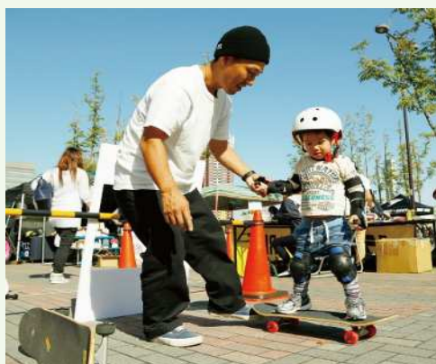
屋外アーバンスポーツパーク