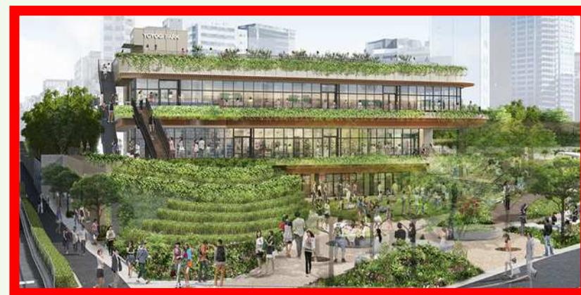
原宿駅側メインエントランス