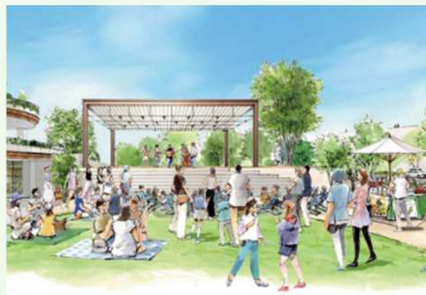
にぎわい広場と発信テラス