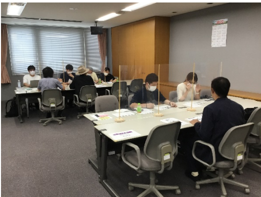
マッチング会の様子(商品開発)