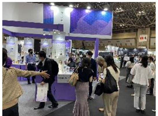
展示会出展の様子(普及促進)