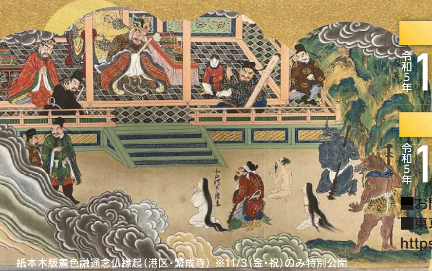
紙本木版着色融通念仏縁起(港区・繁成寺) ※11/3(金・祝)のみ特別公開