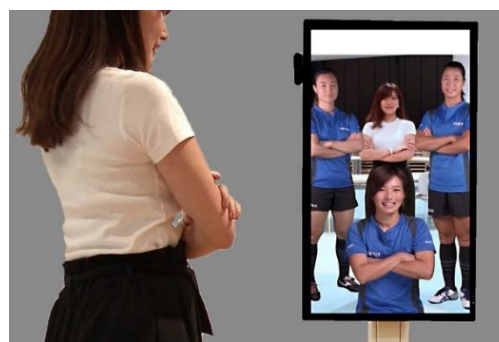
<フォトスポット（イメージ）>