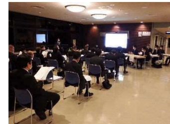
葬儀会社との意見交換