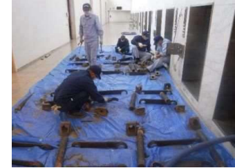
ロストル交換作業