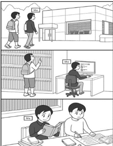
※この画像はタブレットで表示される大きさです。

もんだい じゅんぴ じかん びょうかん ろくおんかいし おと な かいとう はじ かいとう じかん この問題の準備時間は30秒間です。録音開始の音が鳴ってから、解答を始めてください。解答時間は50 びょうい ない 秒以内です。