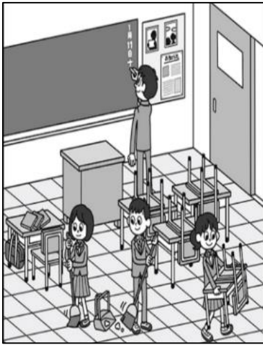
※この画像はタブレットで表示される大きさです。

もんだい じゅんぴ じかん びょうかん ろくおんかいし おと な かいとう はじ かいとう じかん この問題の準備時間は20秒間です。録音開始の音が鳴ってから、解答を始めてください。解答時間は びょうい ない 45秒以内です。