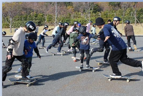
【スケートボード教室（イメージ）】