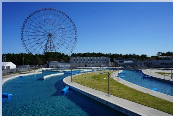
【カヌー・スラロームセンター】

スポーツが日常に溶け込んだ「スポーツフィールド・東京」の牽引役として様々な事業を戦略的に展開する公益財団法人 東京都スポーツ文化事業団（渋谷区・千駄ヶ谷、以下「東京都スポーツ文化事業団」）は、アーバンスポーツの裾野の拡大、普及啓発、競技・マナーに対する理解促進及び都立スポーツ施設の活用や認知度向上のため、「アーバンスポーツ体験プログラム」（年6回予定）を実施します。