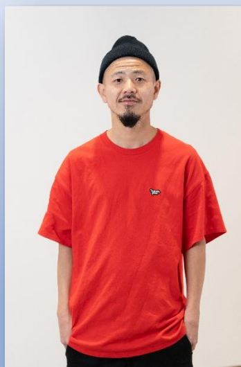
ムラサキスポーツ本社契約プロライダー