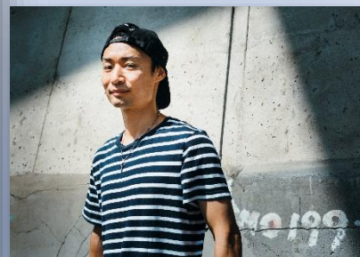
ムラサキスポーツ本社契約プロライダー