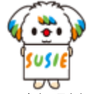
マスコットキャラクター 「SUSIE (スージー)」