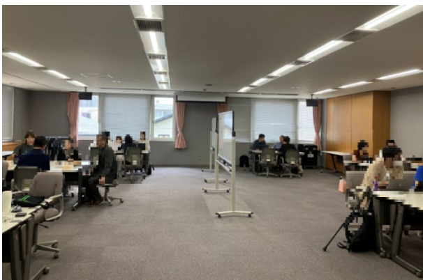
マッチング会の様子(商品開発)