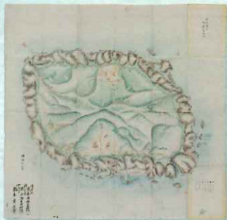
御蔵島之図 伊豆七島ノ七