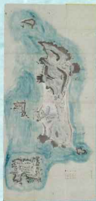
新島之図 伊豆七島ノ三