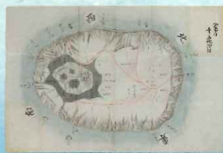
八丈島三 青ヶ島之図