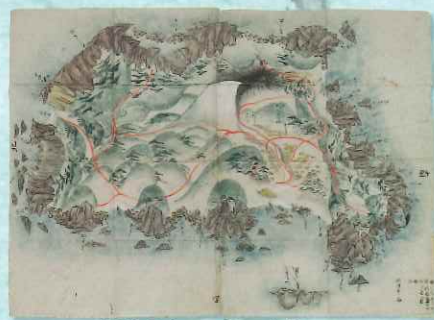
神津島之図 伊豆七島ノ五