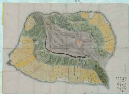
大島之図 伊豆七島ノ一