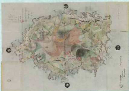
三宅島之図 伊豆七島ノ六