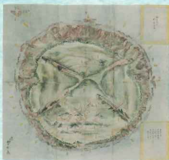
利島之図 伊豆七島ノ二