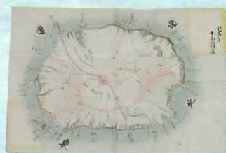
八丈島二 小島之図