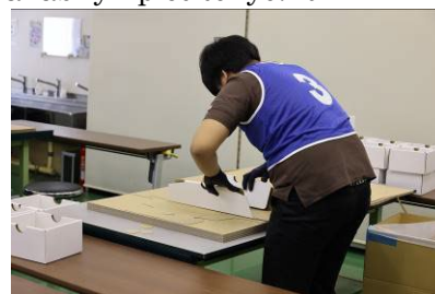
[製品パッキング競技]